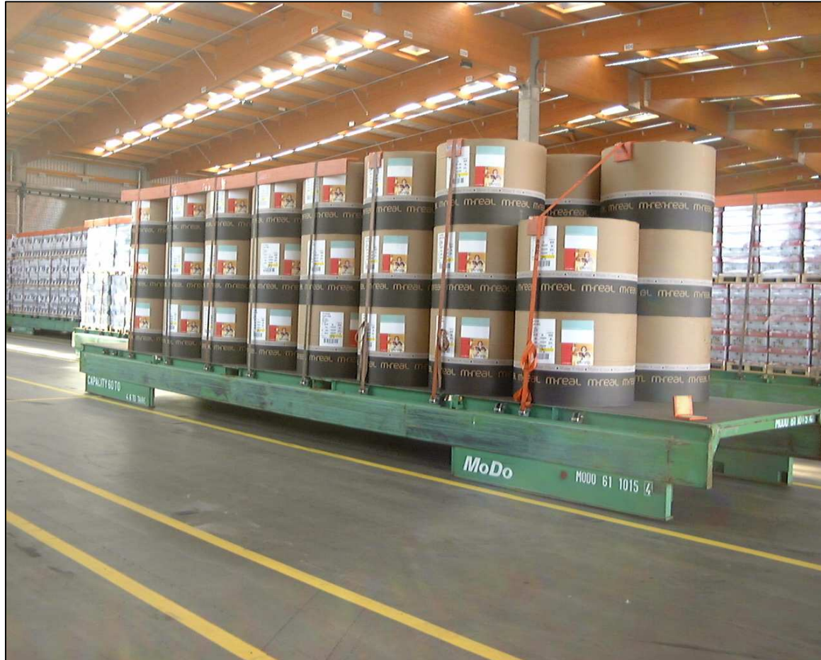
Papier- und Umschlaghalle 33 im Schlutuper Hafen