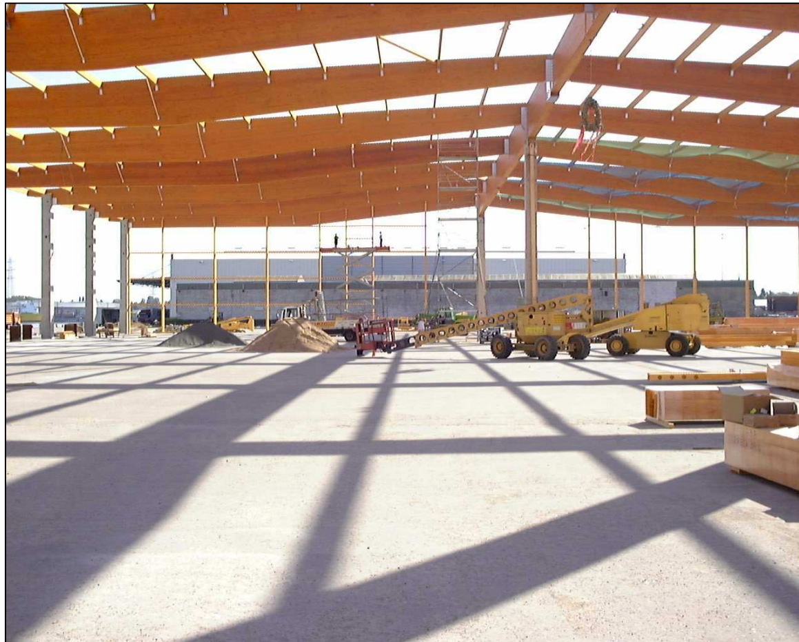
Papier- und Umschlaghalle 33 im Schlutuper Hafen