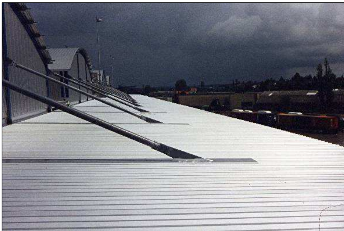
Papierlagerhallen 23-27 im Schlutuper Hafen