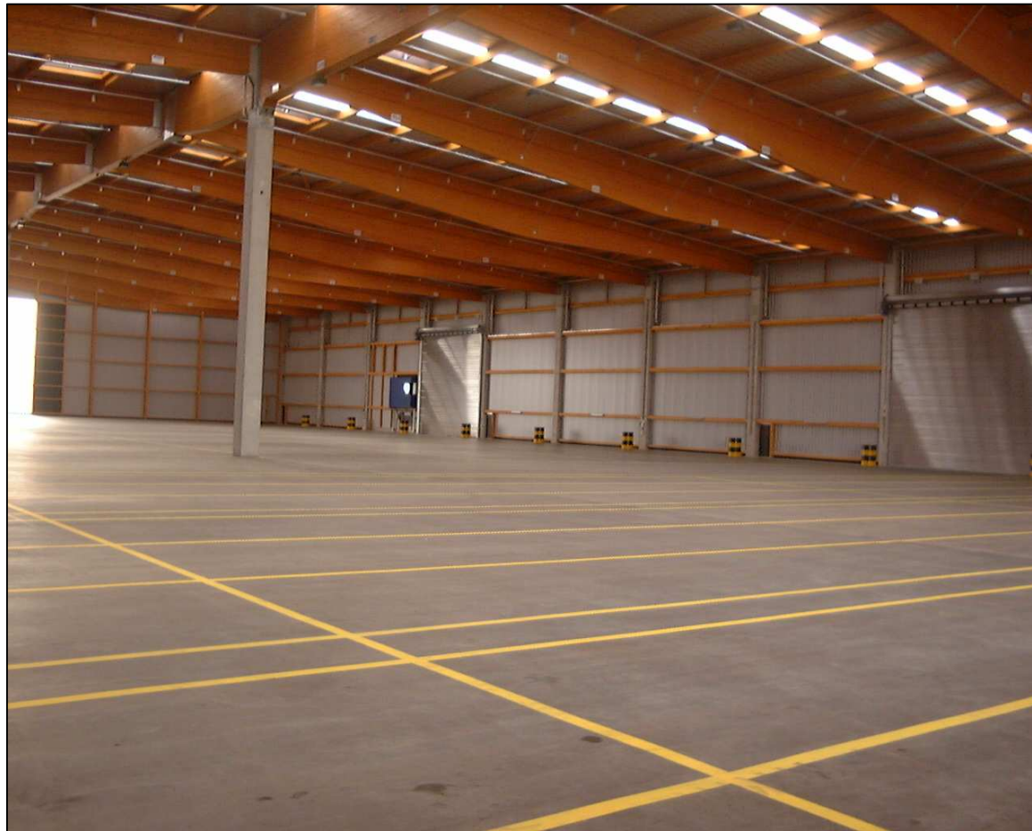
Papier- und Umschlaghalle 33 im Schlutuper Hafen