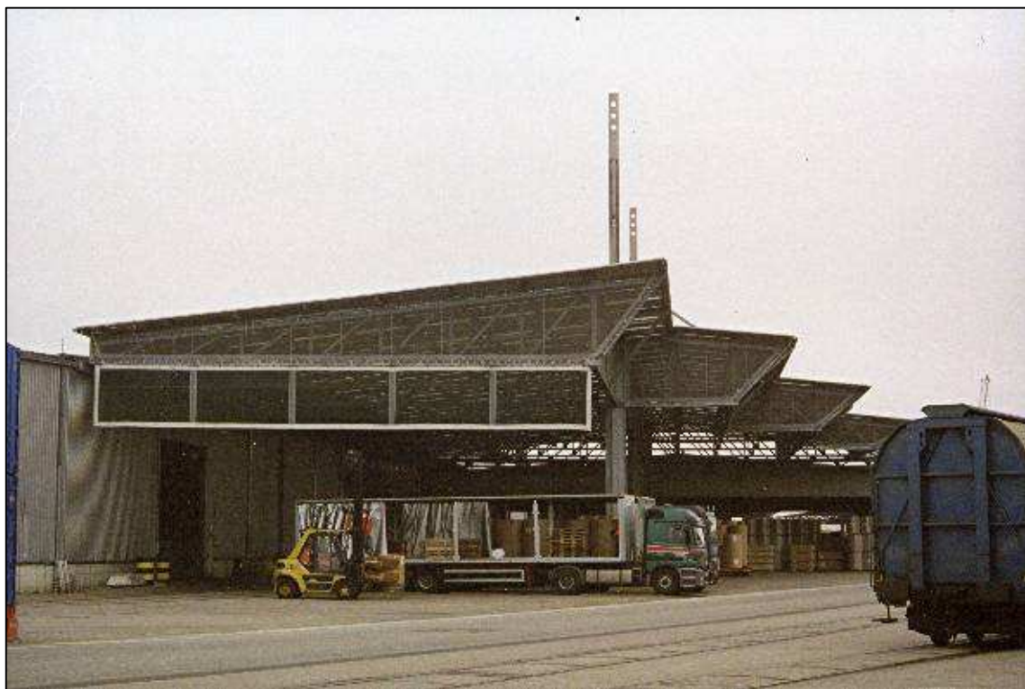
Neubau Überdachung und Halle 63 am Nordlandkai