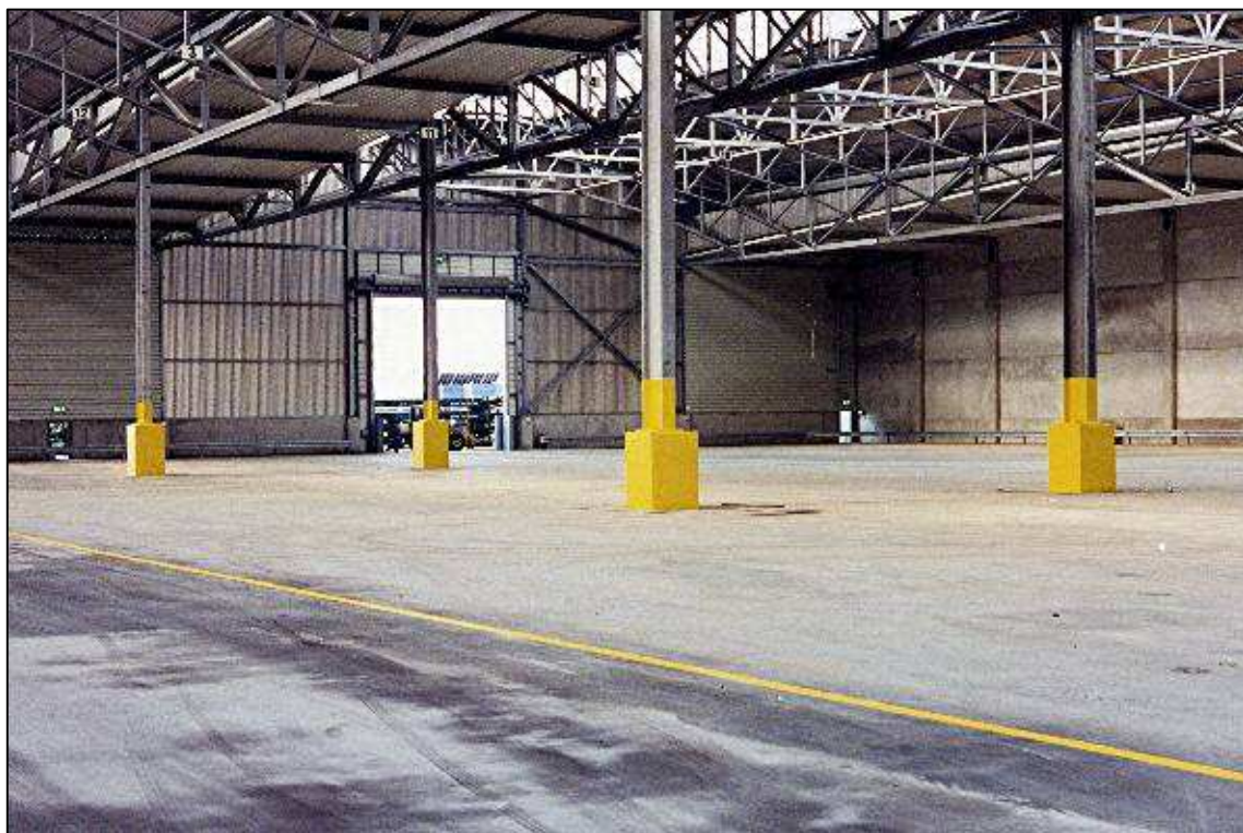
Neubau Papierlagerhallen 23-27 im Schlutuper Hafen