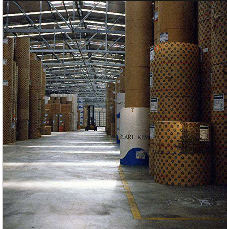
Neubau Papierlagerhalle 93 im Vorwerker Hafen

Auftraggeber: Lübecker Hafengesellschaft